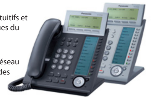
Téléphones propriétaires IP série KX-NT300

Equipés d'une foule de fonctions, les téléphones IP série KX-NT300 sont remarquablement faciles à utiliser. Les téléphones disposent de grands écrans alphanumériques, de touches électroniques à étiquetage automatique, d'un module Bluetooth avec micro-casque sans fil, d'une touche de navigation facile, d'un second port IP (sur certains modèles) pour réduire les coûts et l'enchevêtrement des câbles de bureau, et d'un réglage double inclinaison permettant un contrôle de l'inclinaison séparé et indépendant pour le socle téléphonique et l'écran LCD, tout cela pour vous procurer une convivialité et un confort de bureau accrus.