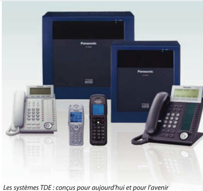
Les systèmes TDE : conçus pour aujourd'hui et pour l'avenir

Investir dans un système de télécommunication exige de bien connaître la communication commerciale. Aujourd'hui, les entreprises doivent être capables de communiquer efficacement, tout en veillant à être bien équipées pour gérer la demande toujours plus exigeante de leurs besoins en communication à venir. Hautement modulaires et dotées de la technologie SIP dernier cri, les nouveaux PABX IP KX-TDE constituent une plateforme de communication idéale pour les clients souhaitant résoudre tous leurs besoins en téléphonie commerciale, aujourd'hui comme demain, en adoptant la téléphonie IP intégrale.