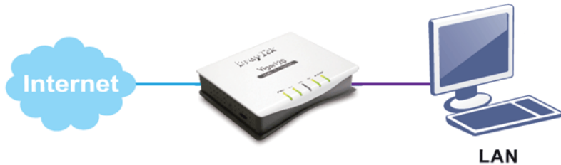
Connection réseau LAN